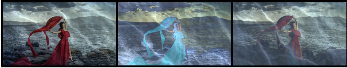
Powerful Thetis , video 1 min.