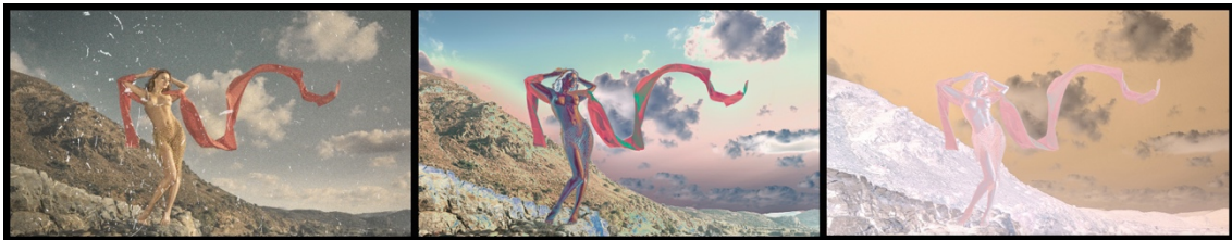
Furious Eos , video 1 min.