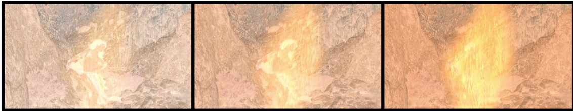
Rising Phoenix , video 1 min.